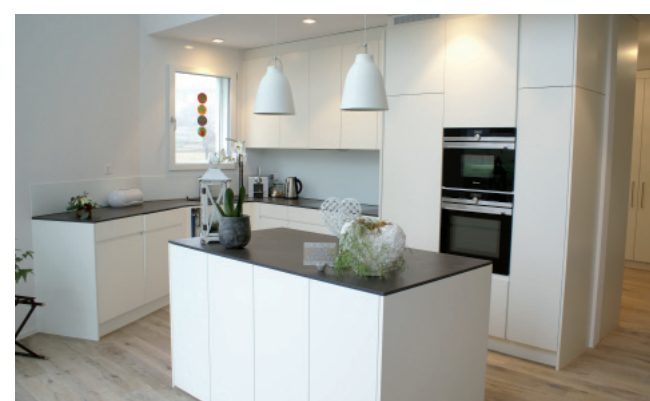
Grenzenlos individuelle Ausführungen – in Perfektion und Design – inklusive fachkundiger Beratung.

Eine persönliche Beratung findet gerne auf Voranmeldung statt. Im angrenzenden Produktionsbetrieb kann man zudem mit eigenen Augen verfolgen, wie die Küche mit modernster Fertigungstechnik entsteht.