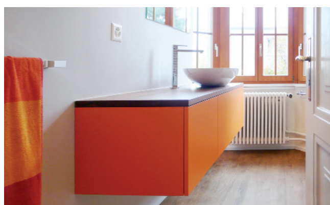
Optimale Beleuchtung, viel Stauraum und ein ansprechendes Design runden das moderne, individuell gestaltete Badezimmer ab.

Mitarbeitenden des FT-Teams legen grossen Wert auf die Beratung der Kundschaft, nicht nur in Bezug auf Funktionalität und Design in der Küche, sondern auch hinsichtlich der Nutzung von Energiesparmöglichkeiten durch den Einsatz der richtigen Geräte am richtigen Ort.